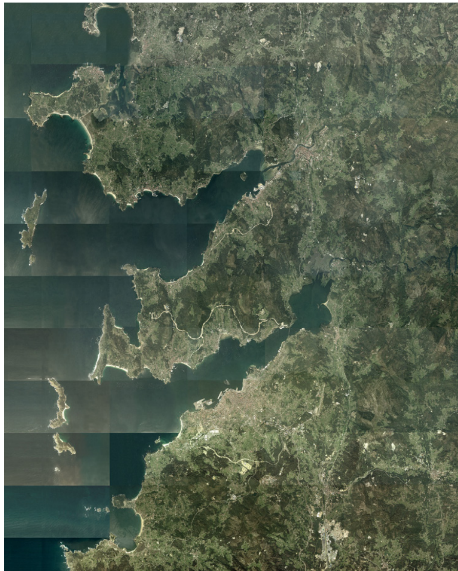
Imaxes correspondentes á rexión de Vigo e Pontevedra. Voo aéreo de 1956-1957 e ortofoto PNOA 2008, respectivamente