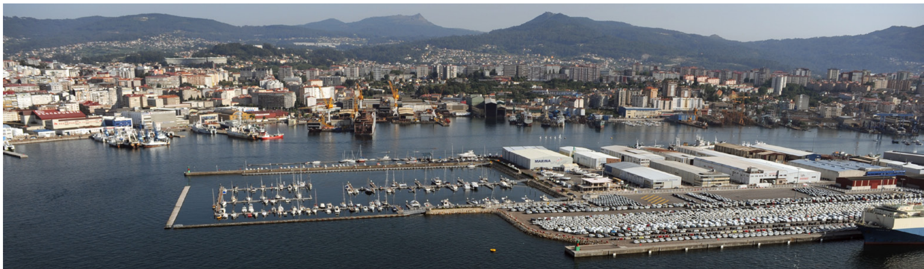
Vigo. Rexión urbana Vigo-Pontevedra