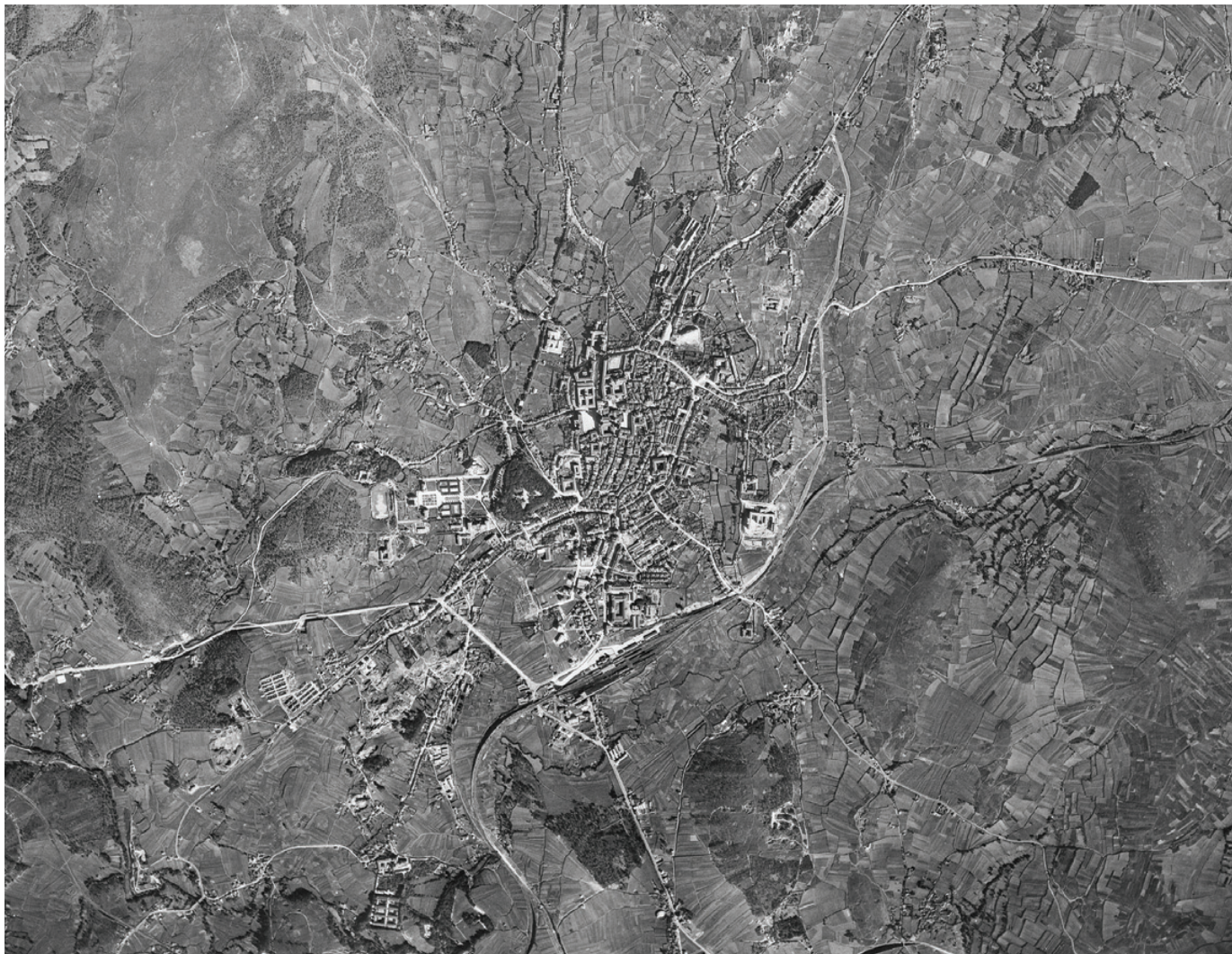
Imaxe correspondente á cidade de Santiago de Compostela. Voo aéreo de 1956-1957