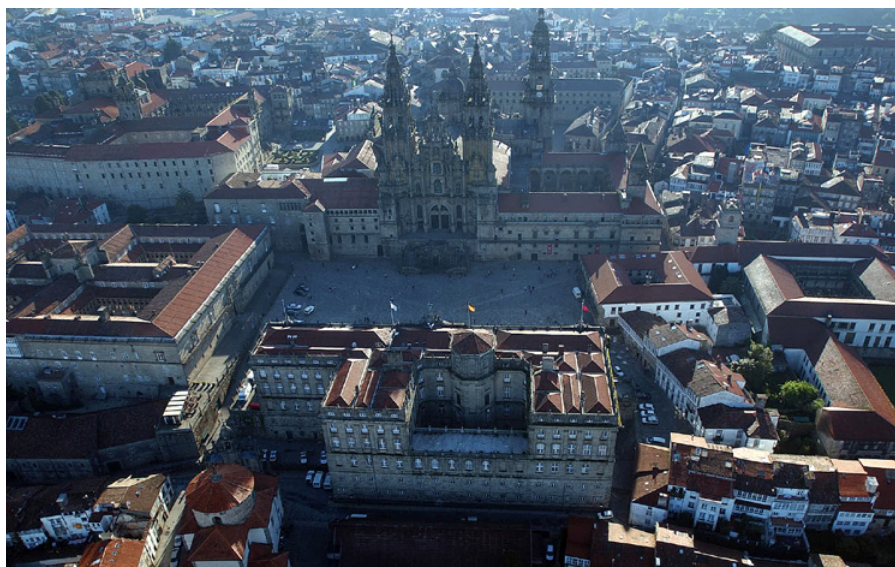
Praza do Obradoiro, Santiago de Compostela