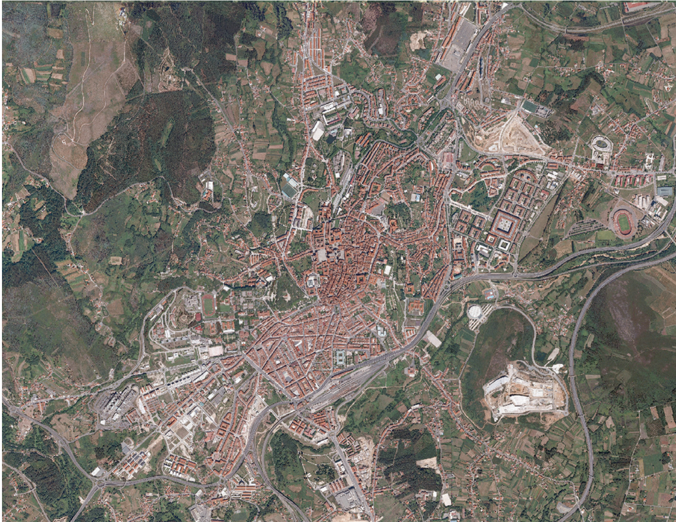
Imaxe correspondente á cidade de Santiago de Compostela. Ortofoto PNOA 2008