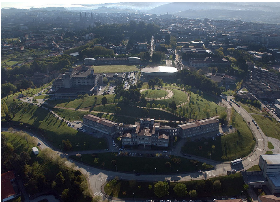
Campus Universitario, Santiago de Compostela