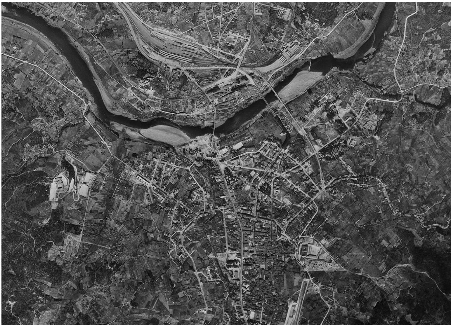
Imaxe correspondente á cidade de Ourense. Voo aéreo de 1956-1957