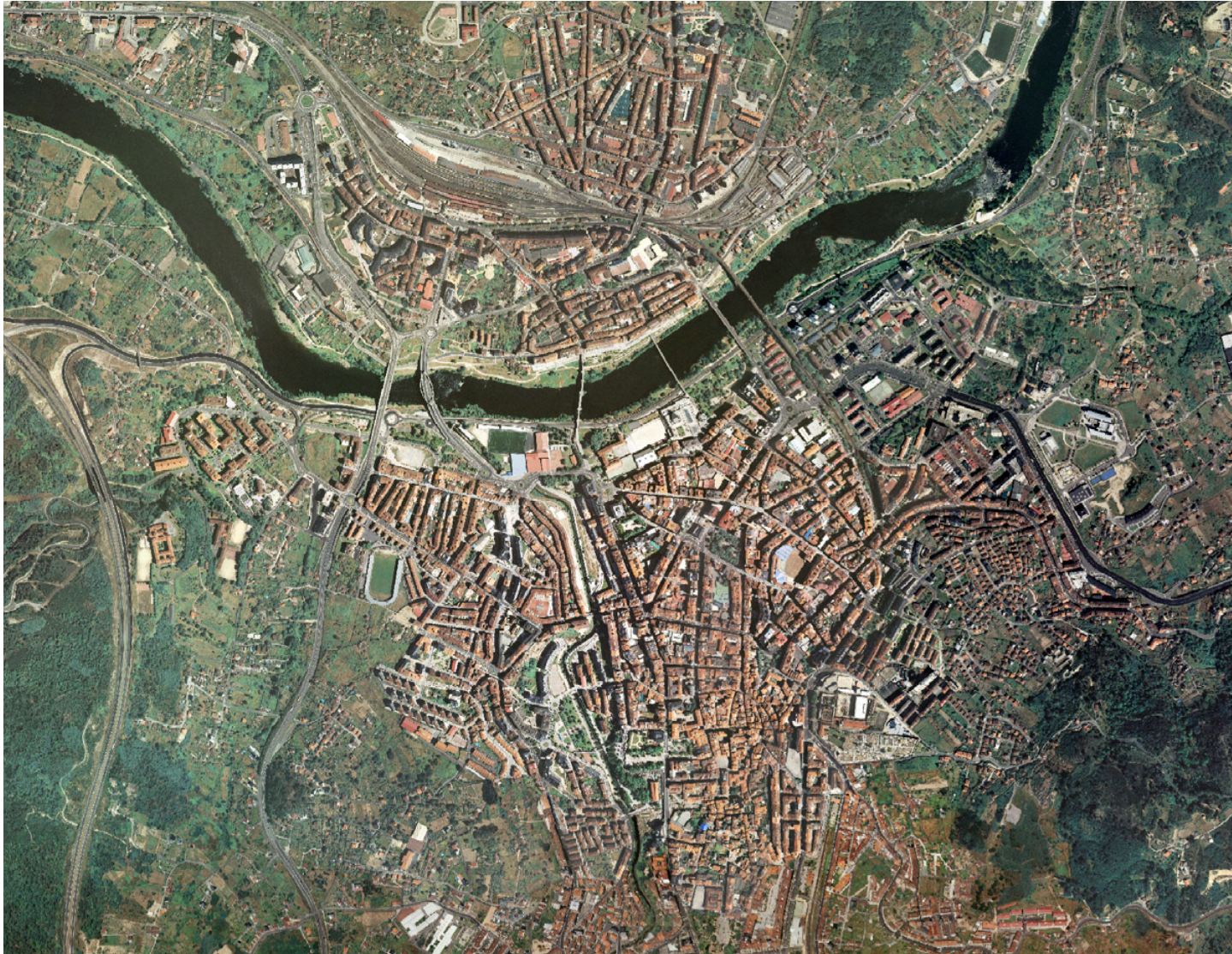
Imaxes correspondente á cidade de Ourense. Ortofoto PNOA 2007