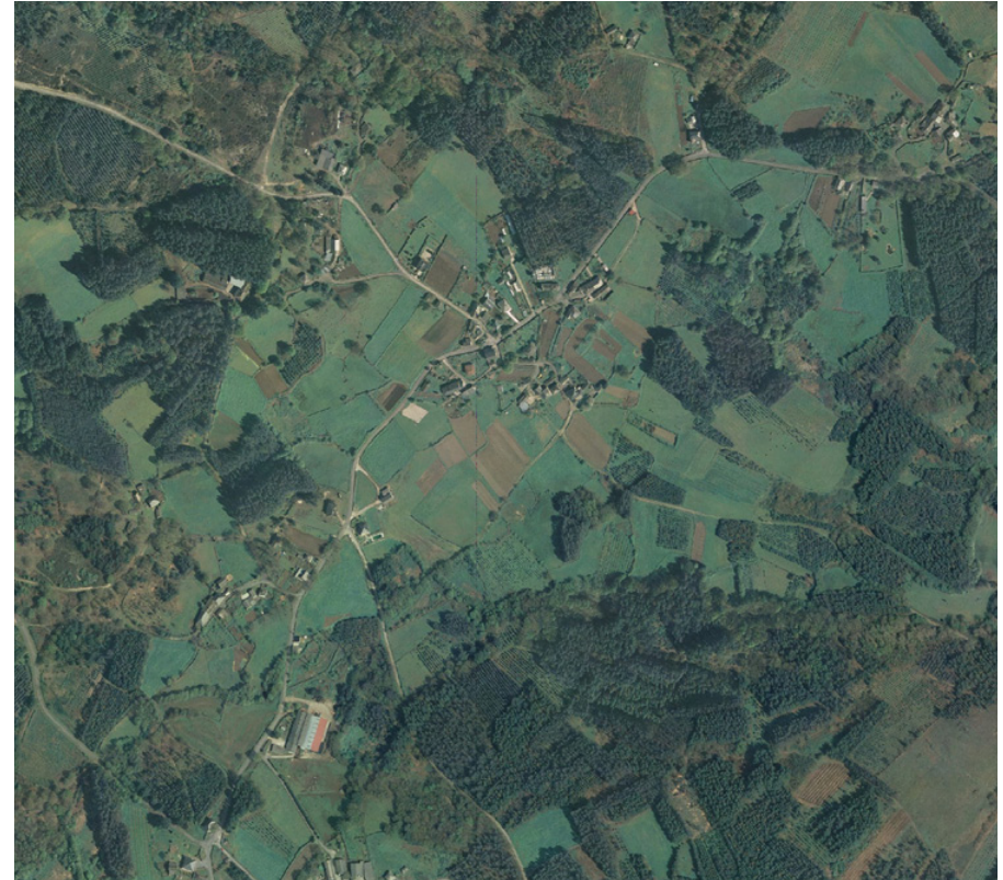
Candai. Concello de Outeiro de Rei

7. Polinuclear laxa: a estrutura particular de cada un dos núcleos que configura o conxunto é de tipo laxo. É a aldea con varios núcleos e o casarío claro.