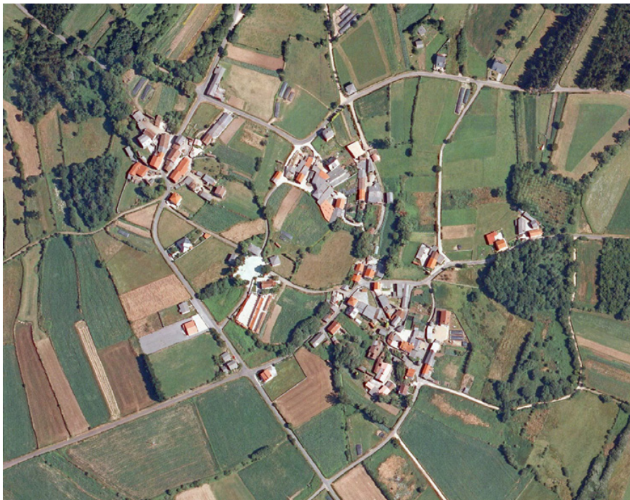
Ortofoto PNOA 2007-2008. San Cristovo. Concello de Santa Comba