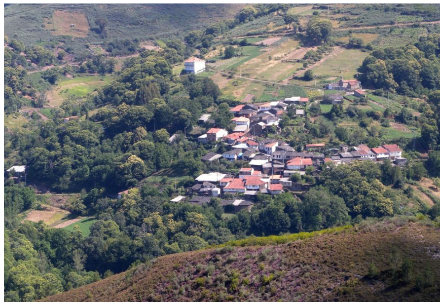
Trez. Concello de Laza

A parroquia, constitúe a unidade mínima de agregación dos asentamentos de poboación, e principal referencia na súa organización espacial e social. Partindo da división do asentamento humano no medio rural nos niveis de casa, aldea e parroquia, son múltiples as tipoloxías que ofrece a realidade dos asentamentos rurais derivadas do relevo e morfoloxía do terreo, da existencia de auga e a capacidade produtiva dos solos, do sistema de organización agraria de cada zona cos seus tipos e formas de cultivo, da propia dinámica demográfica da poboación que actúa no territorio. Os cambios so-