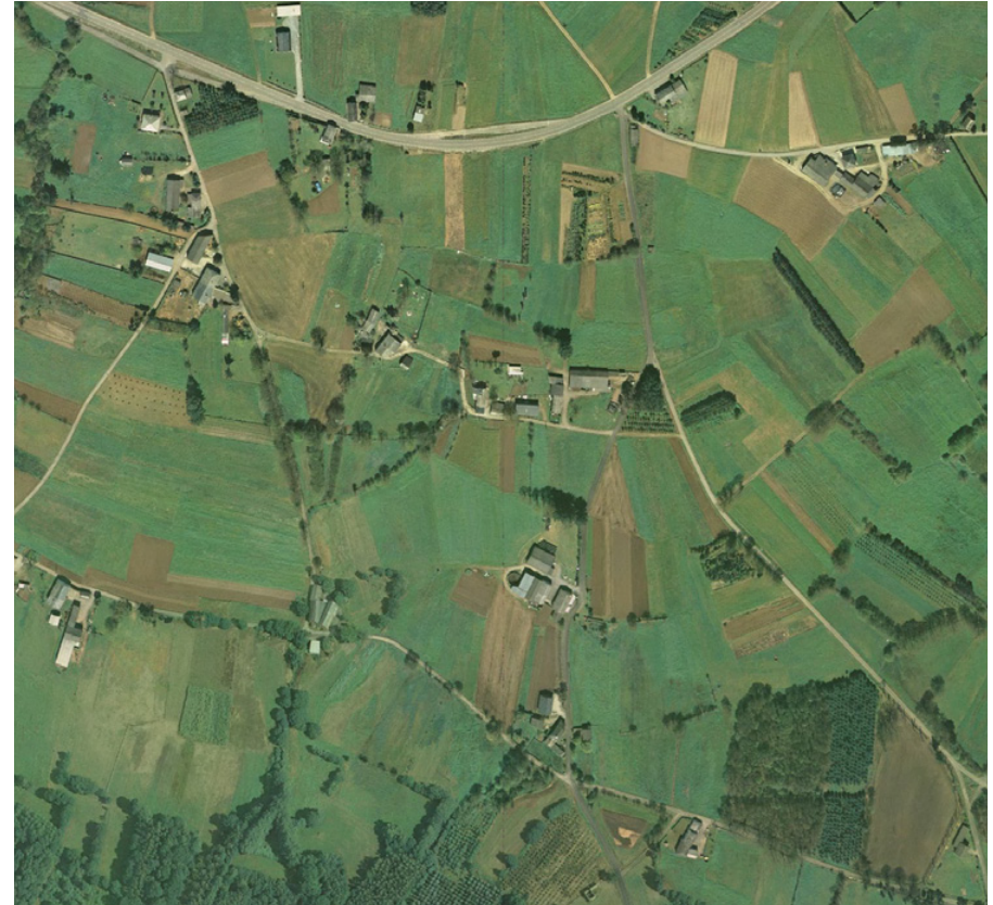
Ortofoto PNOA 2007-2008. Fraga da Vila. Concello de Abadín

4. Mononuclear disperso: entidades cos edificios moi separados, formas indeterminadas e límites difíciles de establecer. Moitas veces trátase de casais bastante separados que aproveitan un val, o río, así como as estradas de certa relevancia. Esta tipoloxía aparece asociada a núcleos tradicionais que creceron recentemente ao longo de estradas de certa importancia.