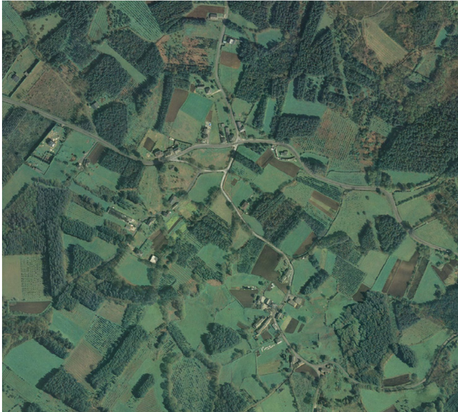
Ortofoto PNOA 2007-2008. Seixón. Concello de Friol