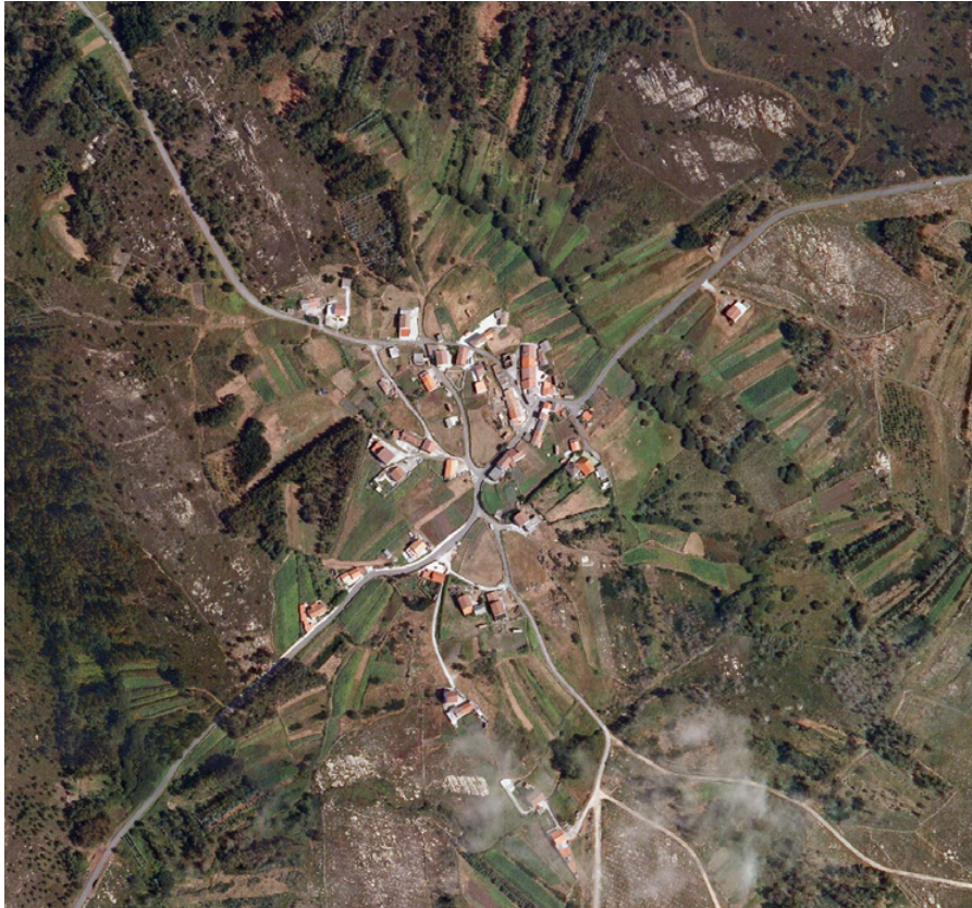
Ortofoto PNOA 2007-2008. Brañas Verdes. Concello de Camariñas