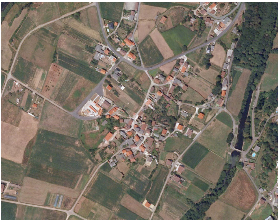
Ortofoto PNOA 2007-2008. Anllóns Grande. Concello de Ponteceso