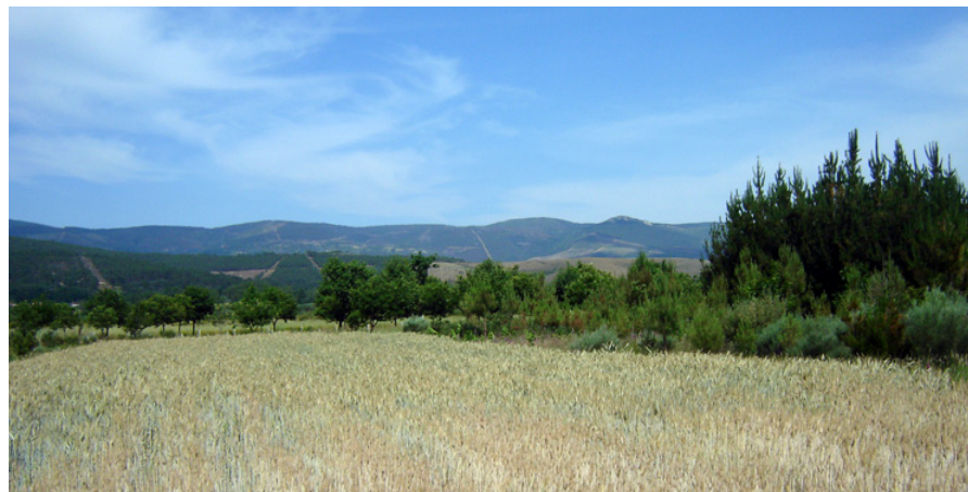
Concello de Verín

As accións de política territorial para estes asentamentos deben partir dun recoñecemento da súa diversidade e, por conseguinte, da adecuación das liñas de planificación ás considerables diferenzas que hai no sistema de poboamento. A dotación progresiva de servizos públicos para mellorar a calidade de vida dos seus residentes, o estímulo á rehabilitación do seu patrimonio construído, ou a posibilidade de compatibilización da actividade agrogandeira e primaria coa residencial son os elementos básicos que hai que ter en conta na realización de políticas públicas vencelladas aos núcleos rurais e ao medio rural.