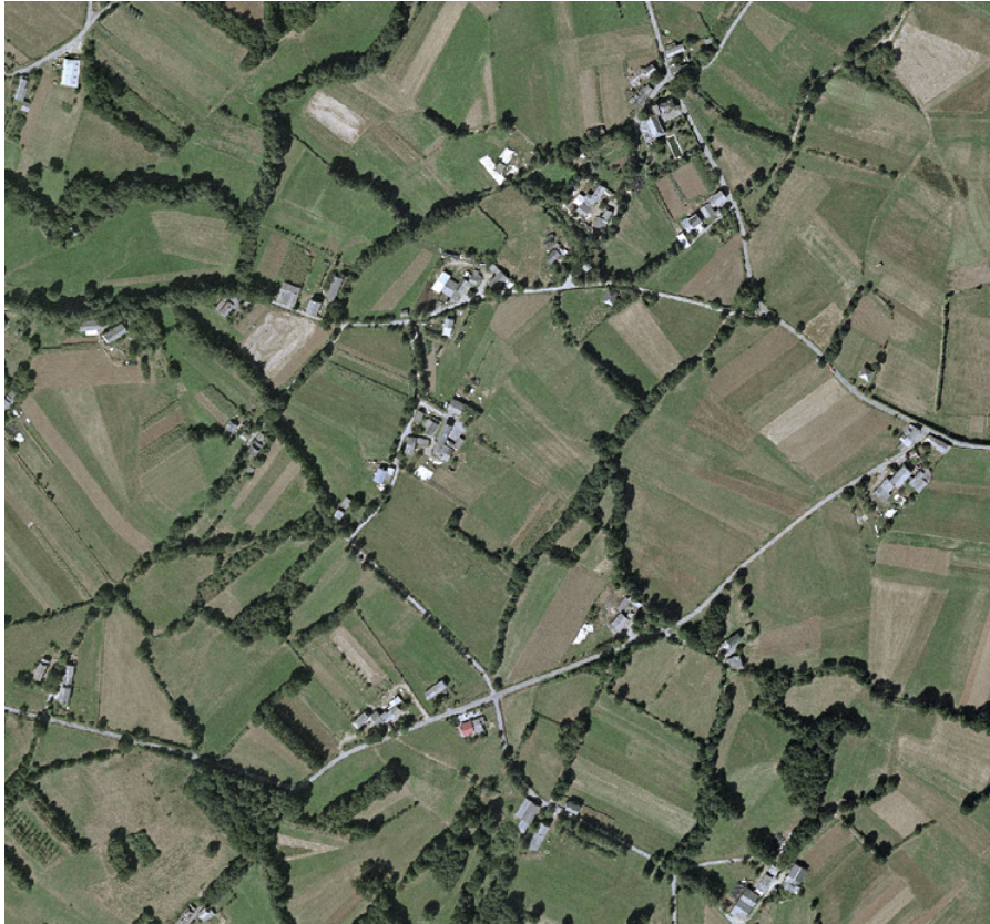
Ortofoto PNOA 2007-2008. A Casabranca. Concello de Cospeito