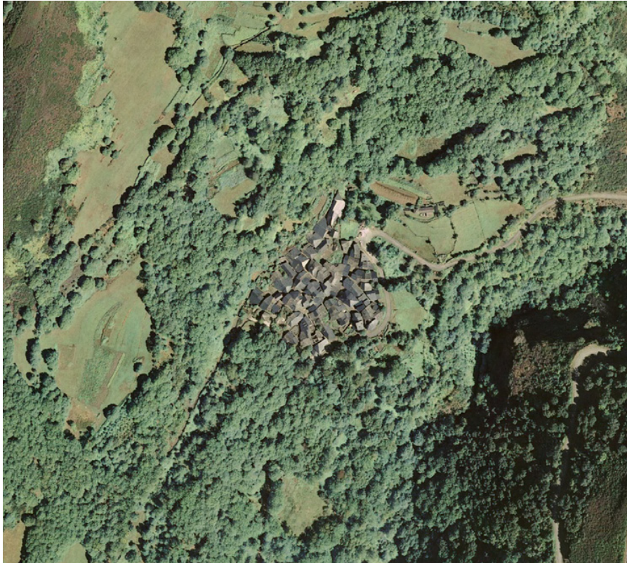
Ortofoto PNOA 2007-2008. Seceda. Concello de Folgoso do Courel