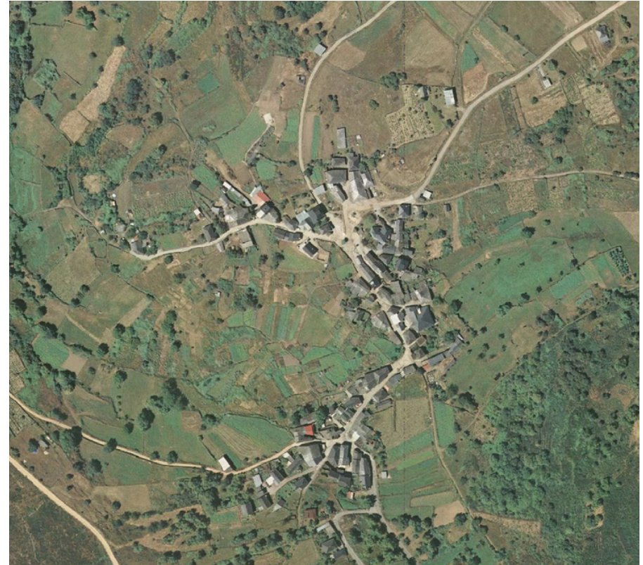
Ortofoto PNOA 2007-2008. Langullo. Concello de Manzaneda

1. Mononuclear moi compacto: asentamento ben definido, de gran proximidade nos elementos constituíntes, de límites nítidos e forma circular ou tendente ao circular. Ten especial relevancia esta tipoloxía no SL de Ourense.