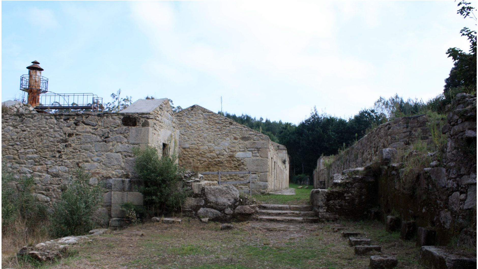
Instalación da antiga fábrica de Sargadelos. Concello de Cervos.