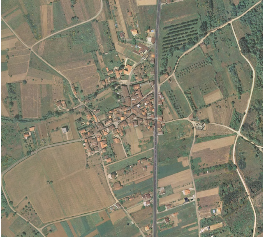
Ortofoto PNOA 2007-2008. Tamaguelos. Concello de Verín