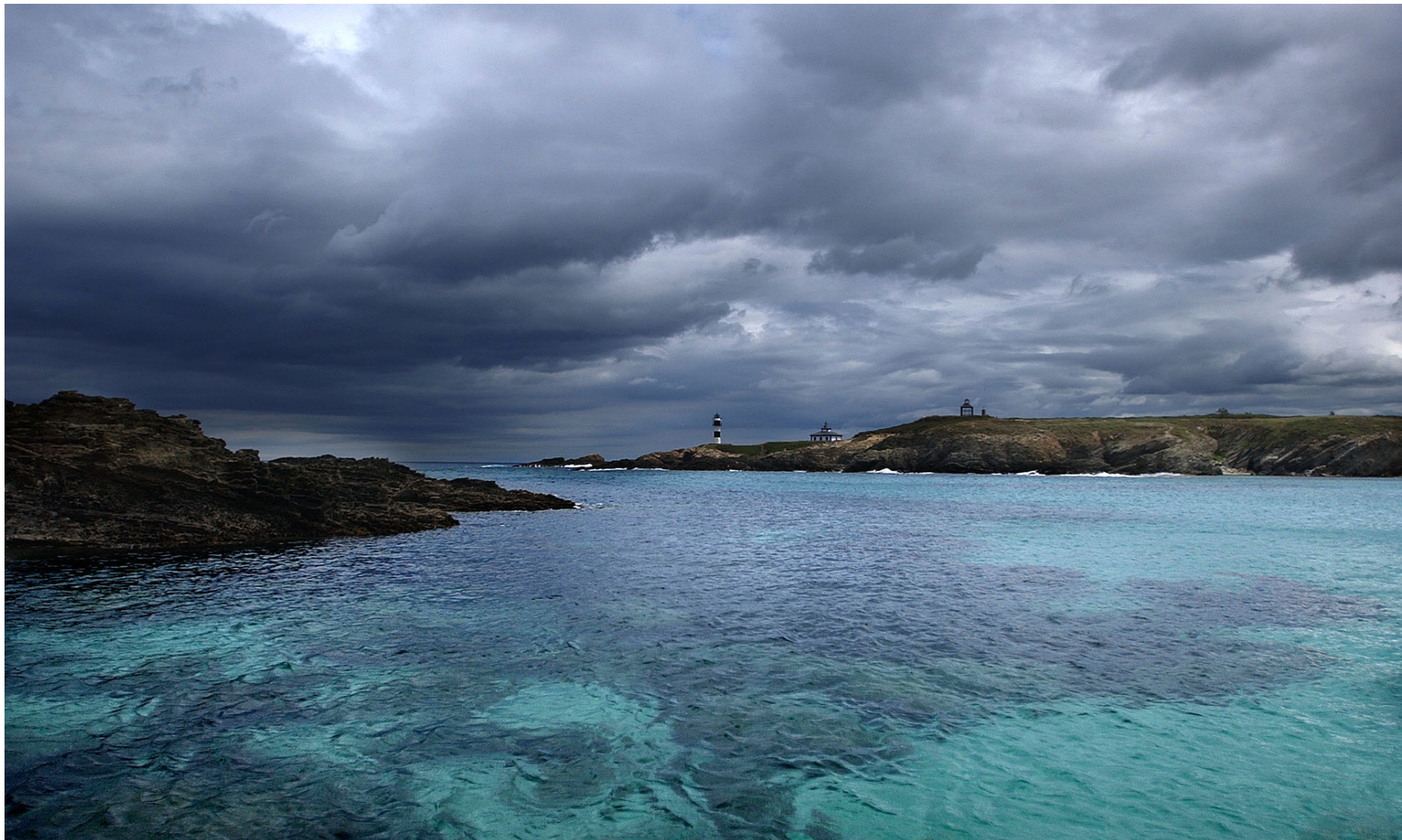
Costa da Mariña Lucense. Faro de Illa Pancha