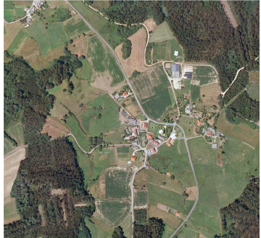
Ortofoto PNOA 2007-2008. O Vilar da Viña. Concello de Irixoa

3. Mononuclear laxa: asentamento no que os seus elementos presentan unha maior separación entre as vivendas (30 a 70 m), con formas indeterminadas, tamaño pequeno e límites pouco nítidos. Este tipo é frecuente nos núcleos atravesados por unha estrada de certa importancia en zonas como as Rías Baixas, o que indica que son núcleos de configuración máis recente.