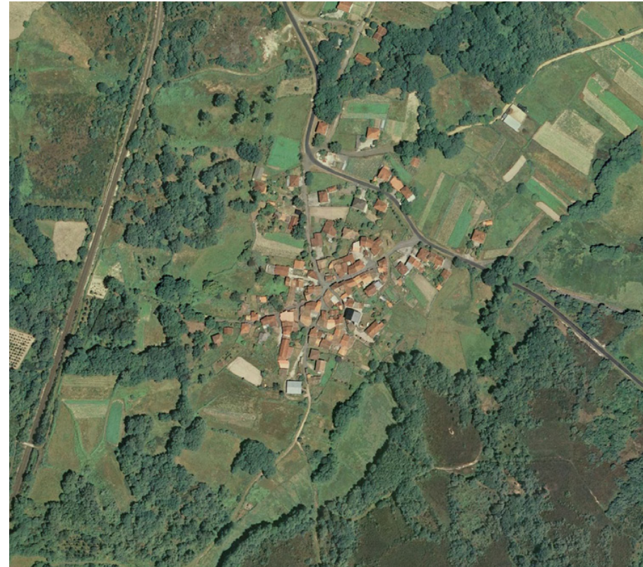
Ortofoto PNOA 2007-2008. Francos. Concello de Baños de Molgas

8. Núcleo compacto e con vivendas diseminadas: asentamento no que dunha das súas partes, normalmente a central, que constitúe o enclave orixinal, de estrutura compacta, se segregan casas como consecuencia da súa dinámica evolutiva ao longo dunha vía de comunicación ou de xeito aleatorio. Forma circular ou indeterminada, límites pouco definidos e fácil de confundir cos asentamentos veciños.