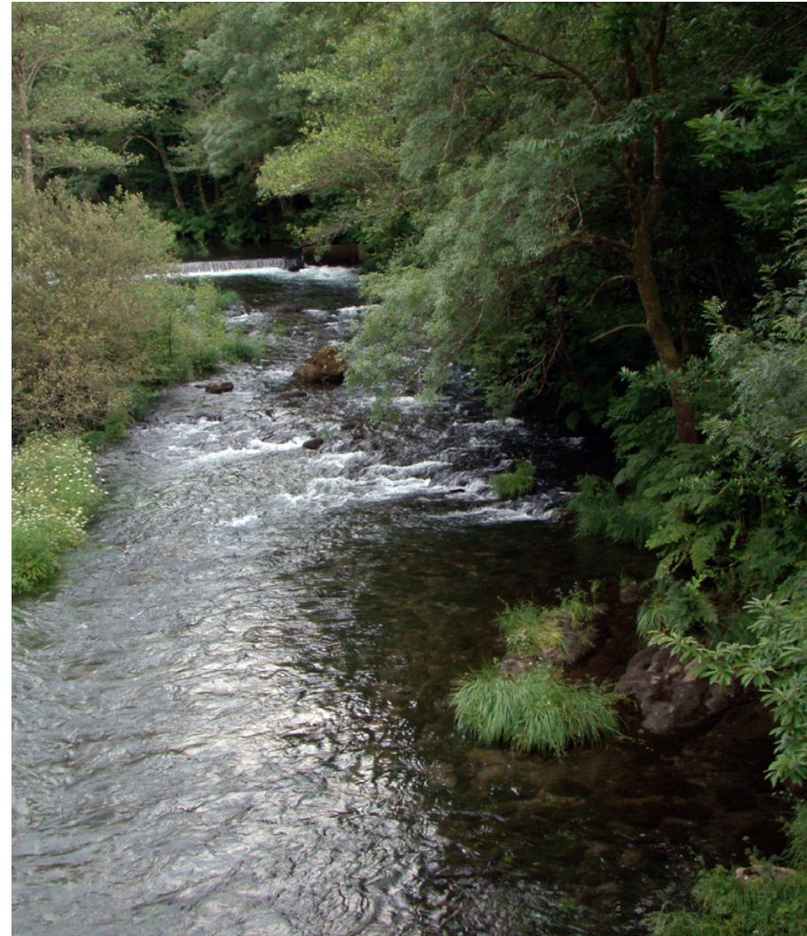
Concello de Monfero. Fragas do Eume

A esta división básica acompañamos a morfoloxía que presenta a entidade de poboación, diferenciando os seguintes tipos: