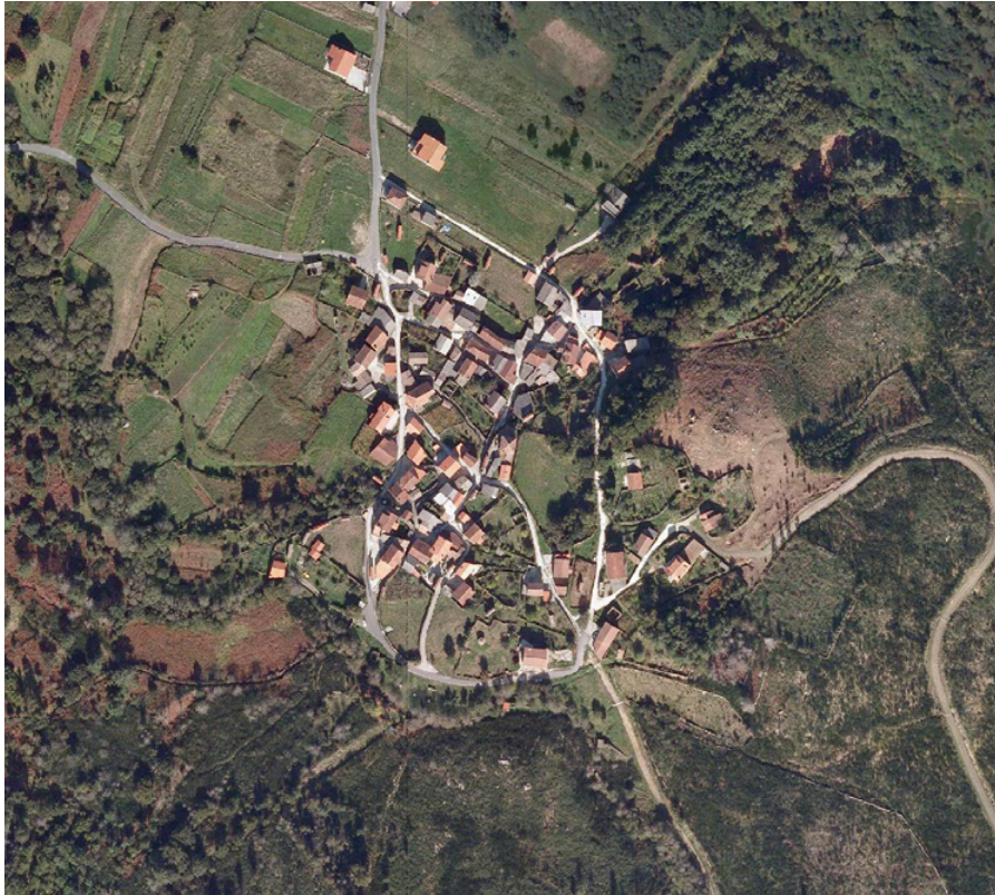
Ortofoto PNOA 2007-2008. Mallou. Concello de Carnota