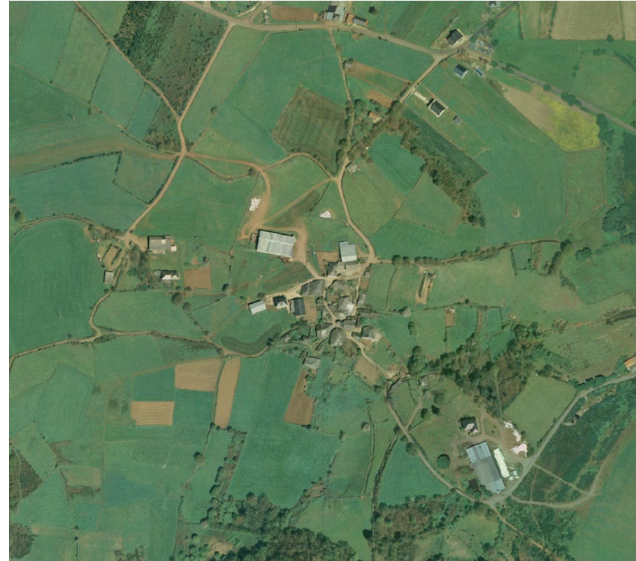
Ortofoto PNOA 2007-2008. Castro de Rei de Lemos. Concello de Paradelá

2. Mononuclear pouco compacta: asentamento no que existe unha certa separación entre as distintas casas por pequenos anacos de terreos libres, pequenas hortas. Forma tendente ao circular e límites nítidos. Esta tipoloxía, xunto coa anterior, constituiría a forma fundamental e o tipo máis antigo de asentamento en Galicia.