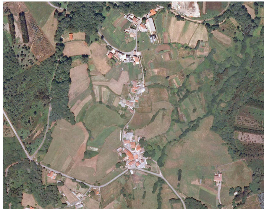
Ortofoto PNOA 2007-2008. Covas. Concello de Forcarei

6. Polinuclear bastante compacta: entidade formada por dous ou máis núcleos separados xeralmente por un accidente topográfico de pouca relevancia. Estrutura articulada coa existencia de varios núcleos pero de menor tamaño e superficie que a de enxame. As formas poden ser diversas e a súa morfoloxía queda pouco definida. Na actualidade existen certas entidades mononucleares que se transformaron nunha destas tipoloxías por incidencia da proximidade de vías de comunicación ao producirse o seu desdobraemento ou multiplicación polo seu crecemento, que no pasado obedecería ao aumento da poboación ou as novas cavas do espazo de cultivo.