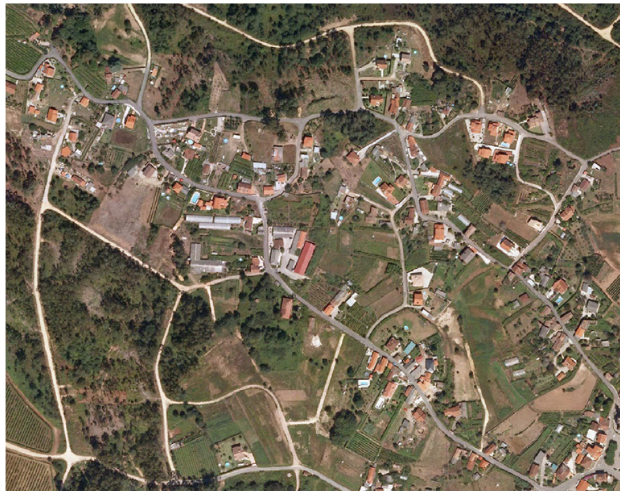
Ortofoto PNOA 2007-2008. Figueiró. Concello de Tomiño

5. Enxame: tipo polinuclear con grupos de casas separadas entre si con edificacións intercaladas. Límites pouco claros; ocupa amplas extensións sobre unha topografía pouco accidentada, e son agrupacións cun mínimo de 15 vivendas e un máximo que supera as 100. Posúe un grao avanzado de dispersión do núcleo mesturando grupos de casas máis ou menos compactas con casas independentes entre elas. Pode ter varios topónimos que identifican distintos sectores. Este tipo de entidade está relativamente ben definida no espazo e recoñecida polos seus habitan-