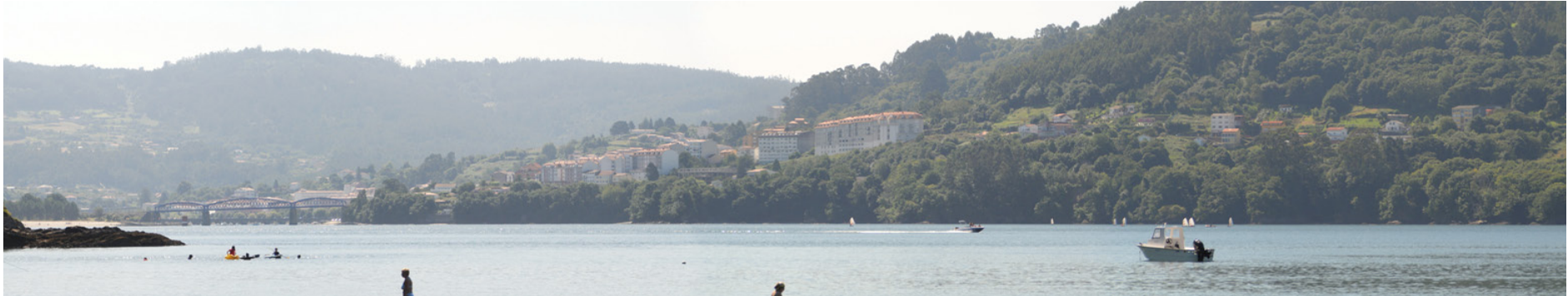
Panorámica da ría de Ares e Betanzos

á estrutura territorial destes espazos verdes que dotan o litoral dun valor engadido de grande importancia.