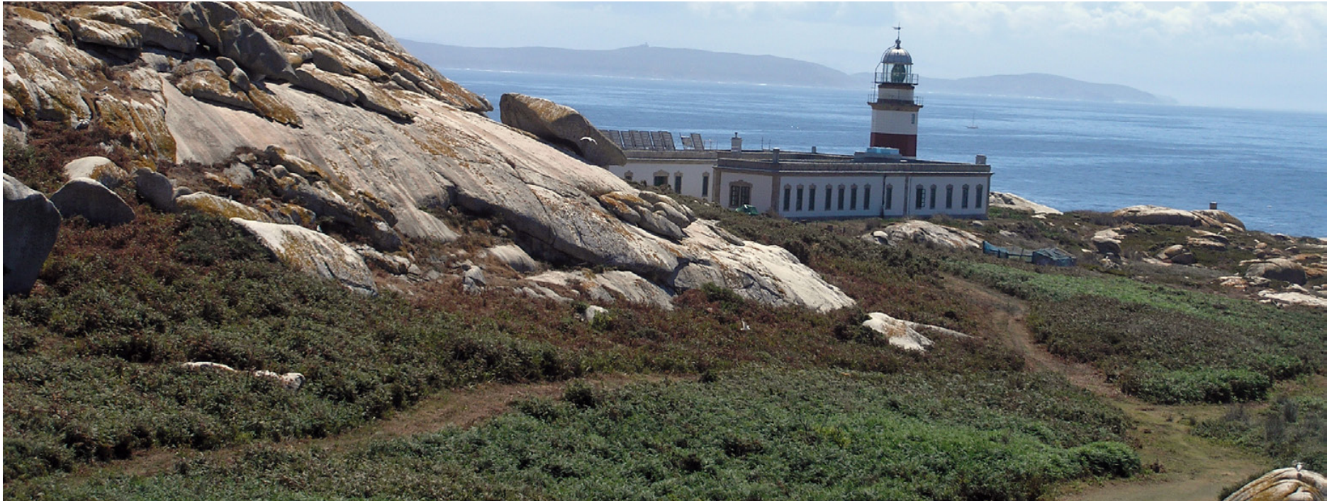
Faro de Sálvora