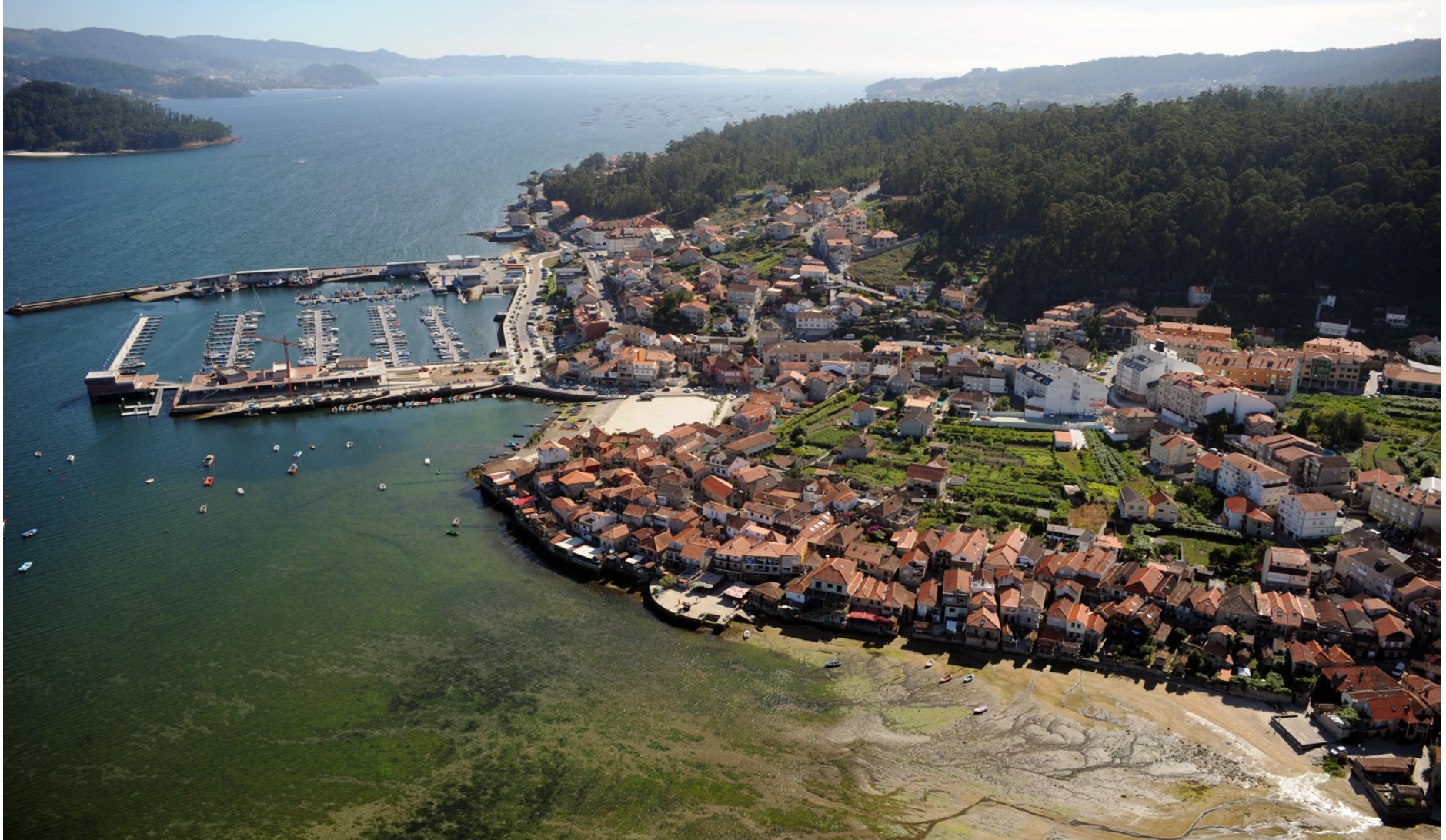
Combarro. Ría de Pontevedra