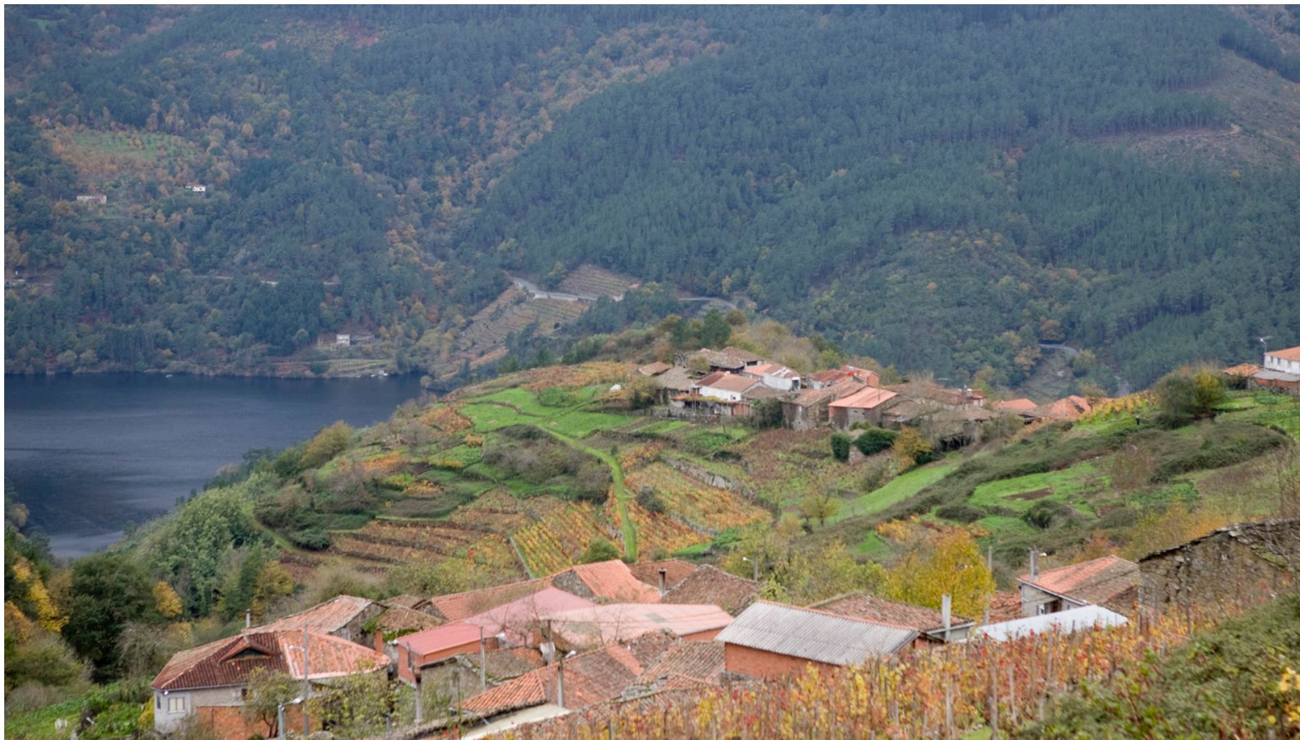
Río Miño. Concello de Pantón