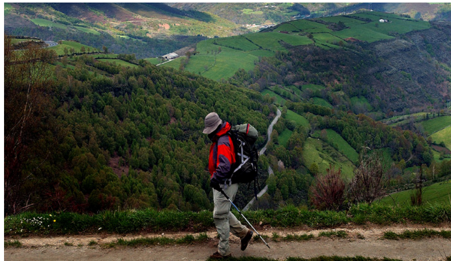
Paisaxe do Camiño francés

9.9. As Administracións priorizarán as estratexias de rehabilitación sobre os Ámbitos de interese do patrimonio cultural contemplados no Anexo IV.