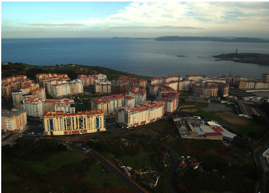
Ría da Coruña

10.1.9. Os departamentos da Xunta de Galicia que, en virtude das súas competencias, deban desenvolver actuacións para a implantación territorial de dotacións, instalacións ou infraestruturas, ou a creación de solo urbanizado destinado á construción de vivendas de protección pública, formularán os correspondentes plans sectoriais, de acordo coa regulación establecida na Lei 10/1995 e a normativa que a desenvolve.