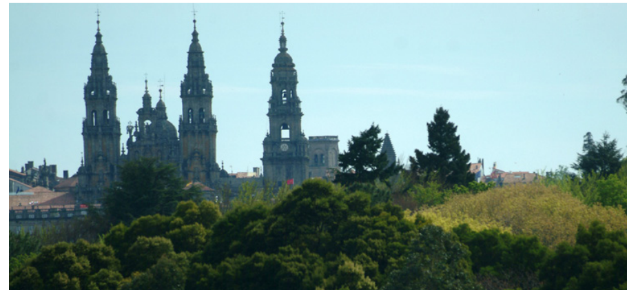
Catedral de Santiago de Compostela

Informe de sostibilidade ambiental e do proceso de participación pública e consultas. Validación por parte do órgano ambiental do proceso de AAE da modificación das DOT coa emisión da preceptiva Memoria ambiental, que poderá conter determinacións vinculantes para ser integradas na versión que se aprobe definitivamente.