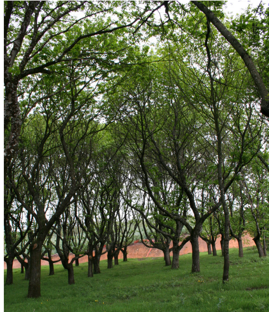
Souto de Zarra de Ventureira. Lalín