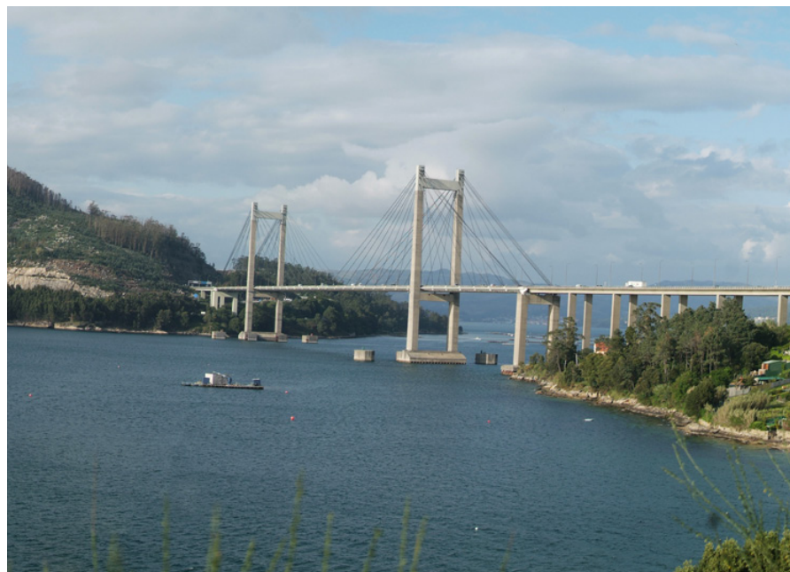
Ría de Vigo

Asemade poderá elaborarse un POMF para a Xestión de terras de Galicia, que pretenda unha mellor implantación territorial das actuacións de xestión de terras como as relativas á concentración parcelaria, ao Banco de Terras, á ordenación forestal, etc