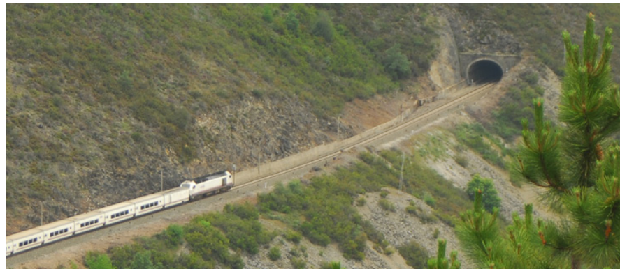
Trazado ferroviario de conexión coa meseta

4.4.5. A Administración autonómica elaborará un Plan director de portos deportivos que, como criterio xeral, fronte á construción de novas instalacións portuarias priorizará o acondicionamento dos portos tradicionais e instalacións existentes para acoller actividades vinculadas á náutica deportiva. En particular, para minorar a afectación á lámina de auga fomentarse a ordenación de fondeaduras e a instalación de mariñas secas e asemade considerarse a protección do patrimonio natural e cultural costeiro, incluíndo o patrimonio arqueolóxico subacuático.