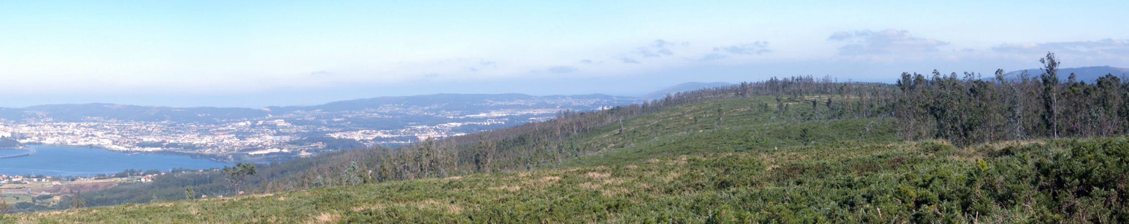
Vista panorámica da Ría de Ferrol

recualificación do litoral, o aumento do atractivo urbano das principais cidades e o aproveitamento das oportunidades singulares dos espazos rurais, sempre nos termos que estableza a normativa específica de cada caso. Porén, figurarán incluídos nesta rede os espazos acondicionados polas diferentes administracións para o desenvolvemento de actividades de lecer ao aire libre, así como aqueles espazos ou áreas con recursos de educación ambiental.