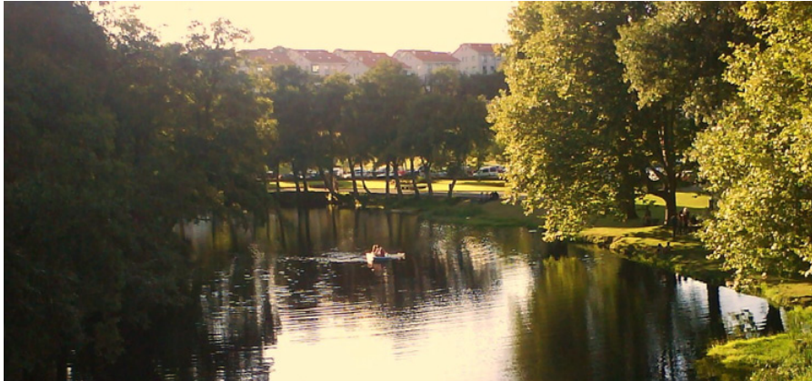
Río Arnoia. Allariz

2.2.6. As Administracións públicas terán en conta na súa planificación que estas vilas subcabecerais exercen funcións complementarias das súas respectivas cabecerais, debido a que constitúen un subsistema urbano policéntrico.