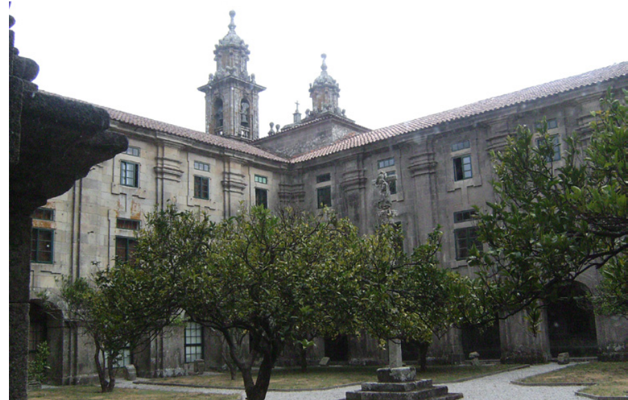
Mosteiro de Poio. Concello de Poio

9.5. Os instrumentos de ordenación territorial e urbanística deberán incorporar as accións e medidas necesarias para garantir a protección e